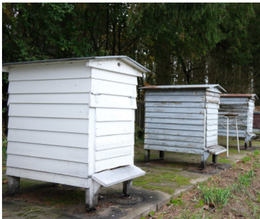
De gamle bistader er næsten 100 år

Vinteren er rolig - og dog ikke helt, hvis man som vi har nogle bistader, der er næsten 100 år gamle.