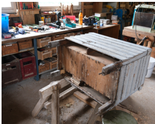
Klar til renovering

De skal holdes ved lige. Og reservedele findes ikke til sådanne stader. Så man må selv fabricere og genskabe de dele, som skal skiftes. Det tager tid, men skønheden ved de gamle "trugstader", som de hedder, gør, at vi holder fast i denne umoderne bistade-type. Ikke fordi vi ikke bruger moderne hjælpemidler. Vores honningslynge er af rustfritstål og med motor.