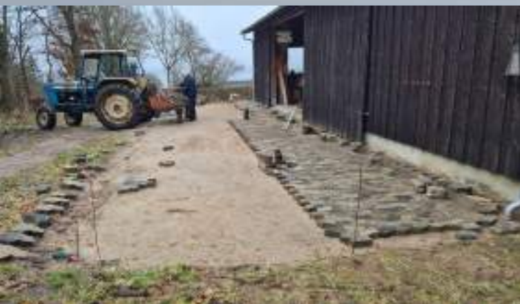
SF sten fra banestien

Vi har nu set på en bunke med SF-sten i nok 8 år. Alle har kunnet se den oppe fra Maskedal, og min kone har kaldt den "Dørup Bjerger". Stenene har vi fået af en vognmand, som havde hentet dem i Østbirk, da banestien mellem Horsens og Silkeborg skulle renoveres. I december skulle det være, og så vidste vi, hvad 2-3 uger skulle bruges til. Da den ene side foran maskinhuset var færdig, startede vintervejret og stoppede alt videre jordarbejde. Men så kom der da "heldigvis" nye opgaver.